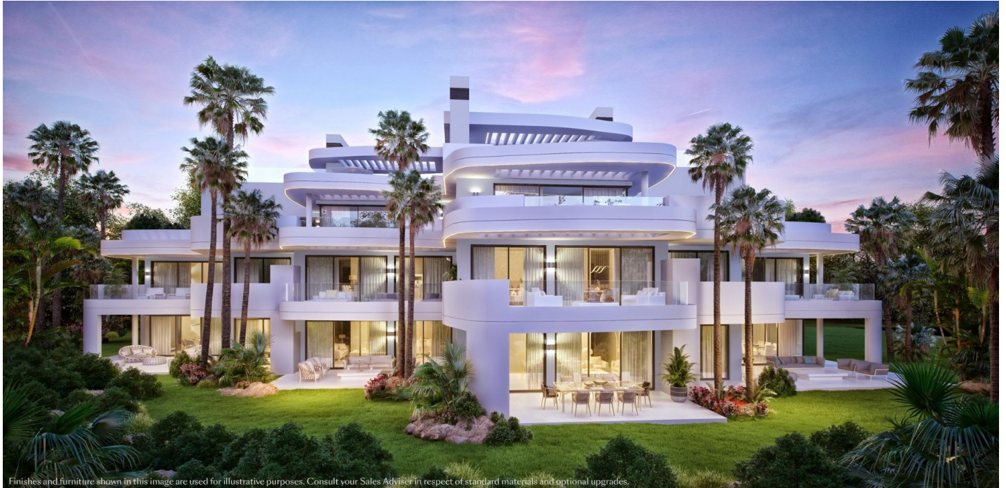
Finishes and furniture shown in this image are used for illustrative purposes. Consult your Sales Adviser in respect of standard materials and optional upgrades.

Referentie: SP0485 Slaapkamers: 2 Badkamers: 2 Perceelgrootte: 108m 2 Terras: 31m 2