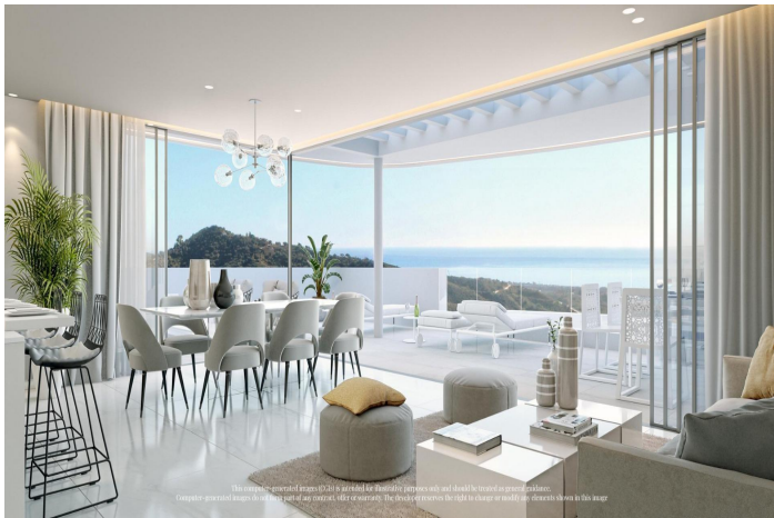
This content is provided for illustrative purposes only and should be treated as general guidance. All content, offers or contracts. The developer reserves the right to change or modify any details shown in this image.