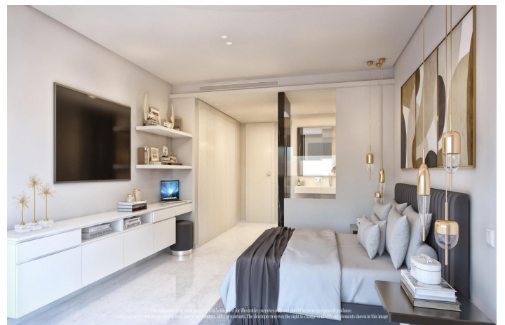
This content is provided for illustrative purposes only and should be treated as general guidance. All content, offers or contracts. The developer reserves the right to change or modify any details shown in this image.